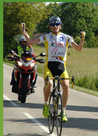
GUIDE DE ROUTE