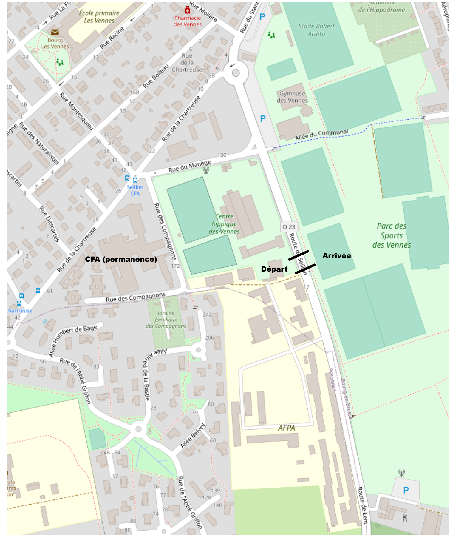
Site départ / arrivée